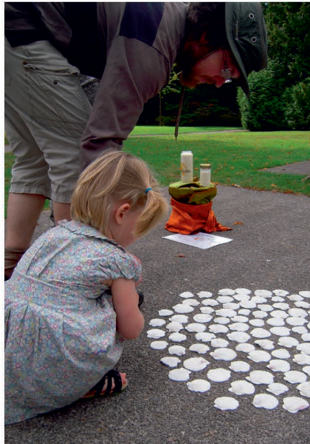
Walk of Peace, september 2016, Enschede