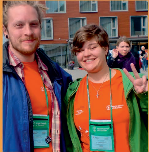
Stewards bij de bijeenkomst van de Wereldraad in Trondheim

Nederland neemt uiteraard het voortouw in deze viering. De jongerenbijeenkomst wordt in Nederland gehouden, binnen het geheel van Nederlandse kerken is de Protestantse Kerk in Nederland voortrekker van dit evenement. Dit gebeurt echter steeds met het oog op het geheel. Zoals ik zie dat internationale ontmoetingen verrijkend zijn, verwacht ik dat er ook binnen Nederland verrassingen zullen zijn in oecumenische ontmoetingen. In een land