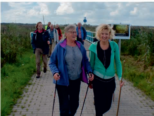
Klimaatloop door aardgasgebied

Deze bedevaart op 7 mei 2017 wordt georganiseerd door de provinciale Raad van Kerken Groningen-Drenthe en Platform Kerk en Aardbeving. Kerk en Aardbeving is een breed oecumenisch en regionaal samengesteld platform dat bezig is met een kerkelijke inbreng in de aardbevingsproblematiek. Het adres van de site is https://sites.google.com/site/kerkenaardbeving/