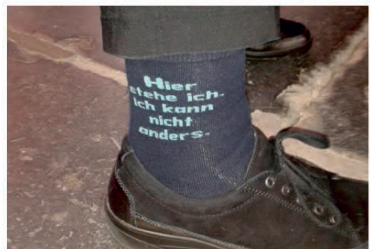
Luther aan de voet